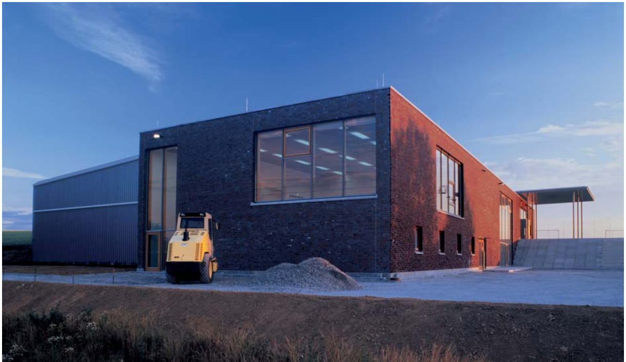
Ausgewählte Projekte: Sporthalle "Seehansen" in Ditzingen Hirschlanden