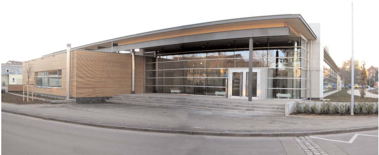
Ausgewählte Projekte: Sporthalle in Korntal