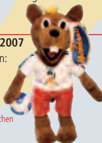
Das WM-Maskottchen HANNIBALL